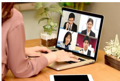
各社で導入が進むオンライン会議

新型コロナを契機に働き方改革が進むなか、5社に1社以上は、ペーパーレス化やEC販売の強化、RPAの導入といった取り組みを予定していた。今後それらに関連したビジネス機会の創出が期待される。