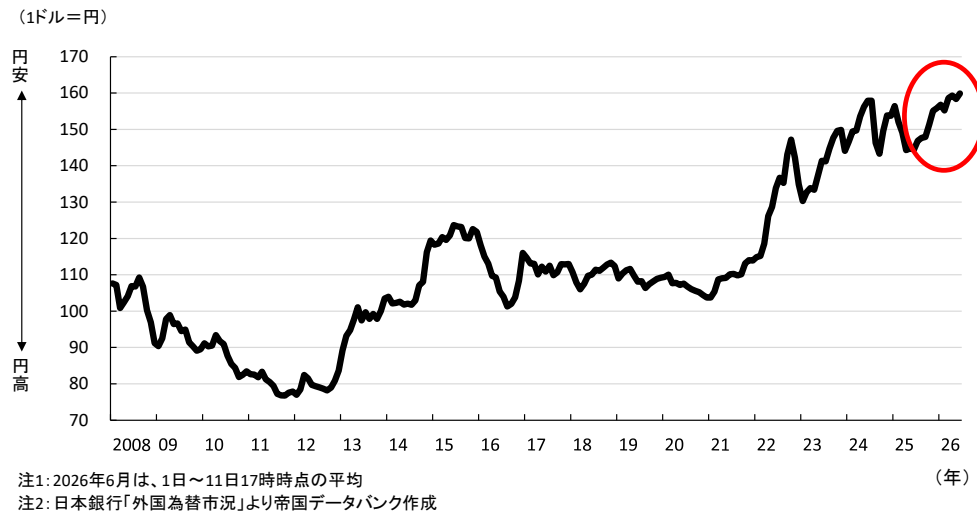
図表 1 外国為替レートの推移

企業が業績見通しを作成する際に想定(設定)した名目為替レートと、実際の為替レートとの間に大きな乖離が生じた場合、その差は企業の事業遂行や業績に大きな影響を与える。とりわけ、価格転嫁力や為替ヘッジ手段に制約を受けやすい中小企業では、想定為替レートと実勢レートの乖離が収益計画や資金繰りを通じて、企業の信用力にも影響を及ぼすことがある。