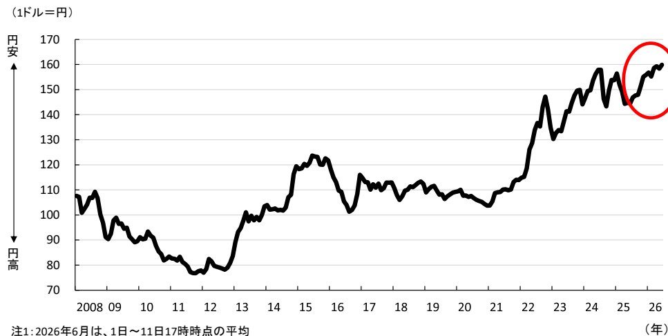
図表1 外国為替レートの推移

そこで、帝国データバンクは、企業の想定(設定)為替レートについて調査を実施した。本調査は、TDB 景気動向調査 2026 年 5 月調査とともにを行った。