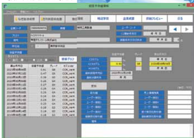
▼[倒産予測値情報照会]画面